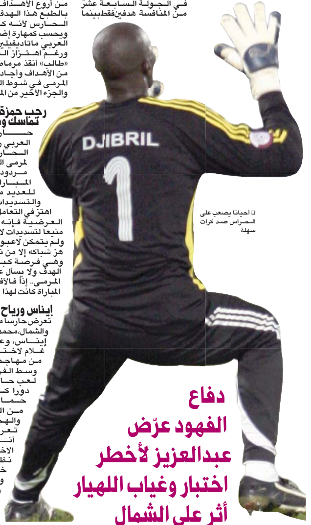
ت أحيانا يصعب على الحراس صد كرات سهلة